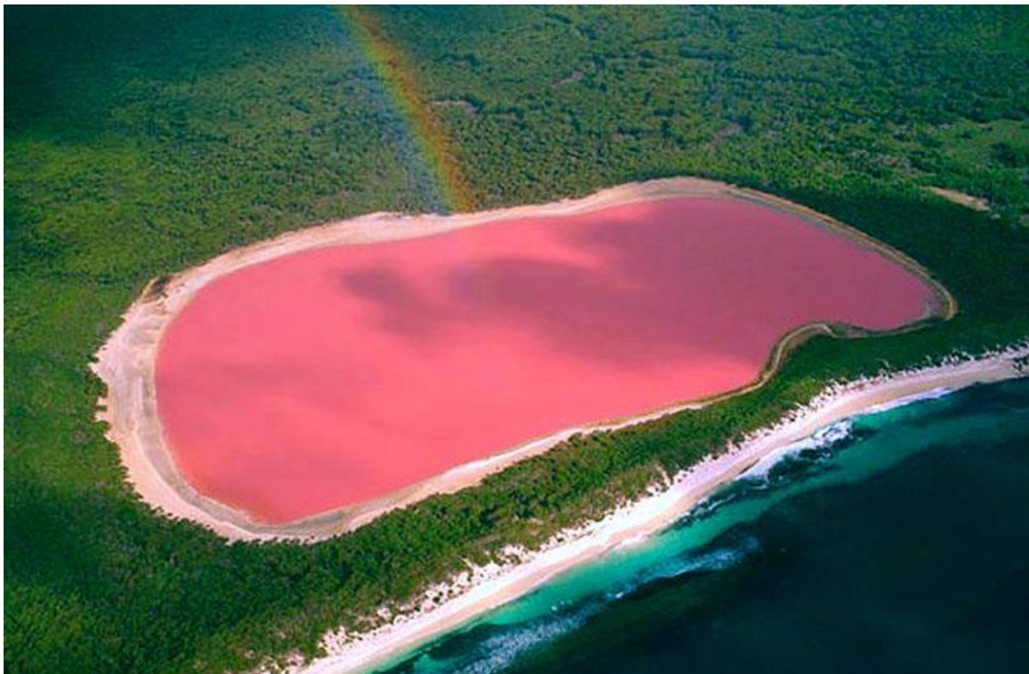
Liqeni Hillier - Australi

Ben je op zoek naar een bijzondere locatie voor leuke foto's? Dan moet je naar het Hillier meer in Australië. Dit meer is namelijk knalroze!